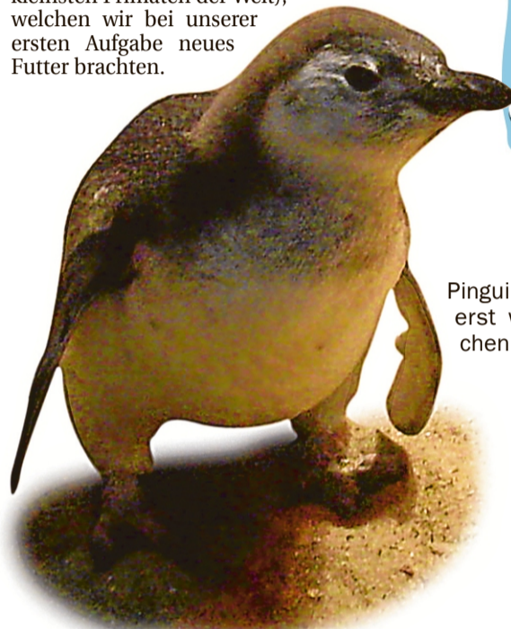
Pinguin Pepsi ist erst wenige Wochen alt.

men muss, lebt er vorerst in einer gemütlichen, abgegrenzten Box im Nebenraum.